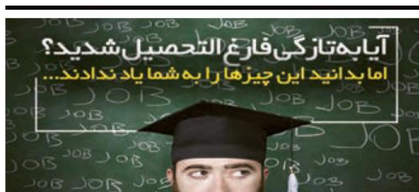
فنون اقناع :