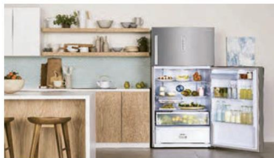
فنون اقناع :