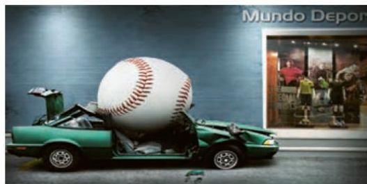
فنون اقناع :

۱۸- در هریک از تصاویر زیر فنون اقناع بکار رفته را ذکر نمایید. (۲) درس ۸ ص ۶۰