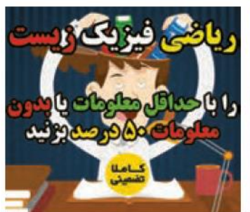
فنون اقناع :